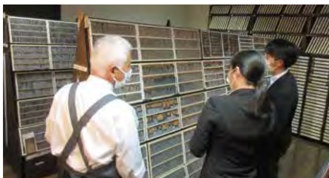
印刷博物館（印刷工房）見学の様子